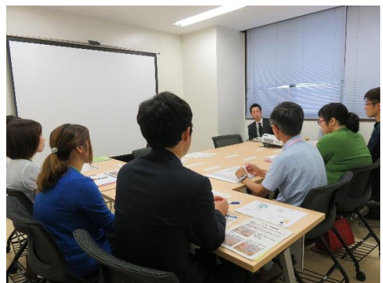
交流集会【理学療法士会】の様子