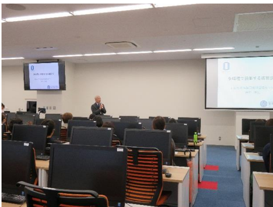
全体講義「多職種で協働する術前評価」の様子